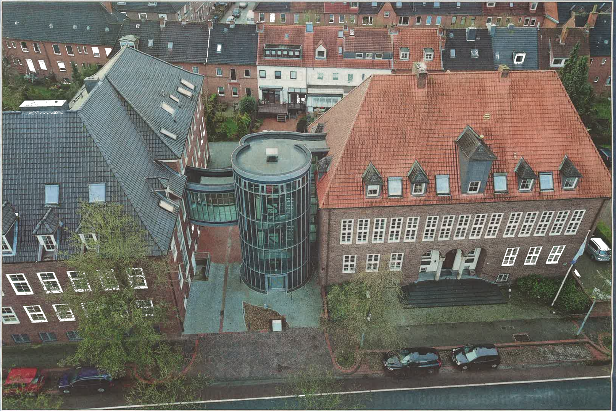
Der gläserne Turm verbindet über eine Brücke das erste Obergeschoss des IHK-Hauptgebäudes mit dem des Dollarhauses.